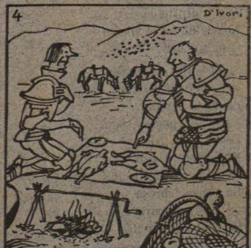
...DE L'EDAT MITJANA