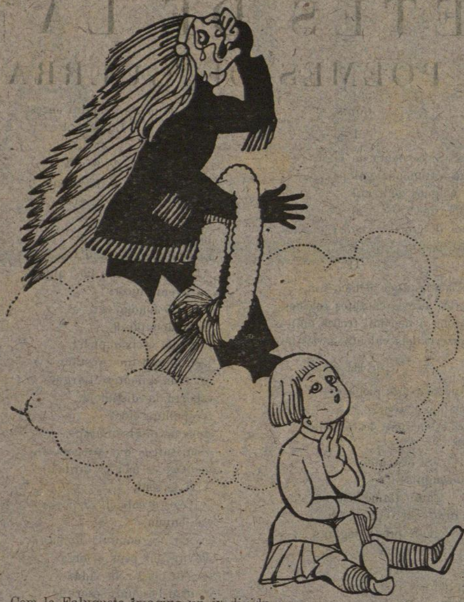
Com la Falugueta imagina un in dividu.