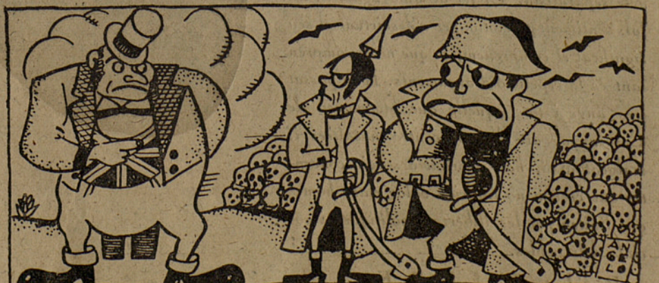
JOHN BULL. — ¿A què no us atreviu a tornar-me a prendre la palleta de l'orella? (De Baraguà de L'Havana).

Les J.E.R.E.C. recorden la dignitat inigualable del President Companys, en la gloriosa data del 6 d'octubre del 1934