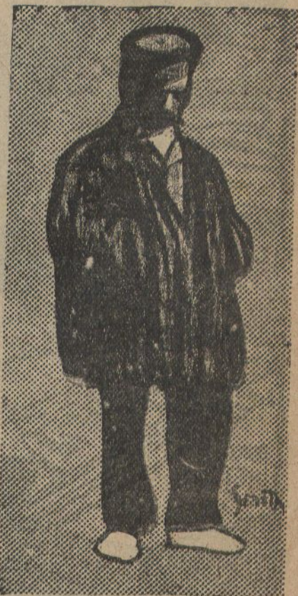
— Ja ho sé que 'ns ensarrona; pero té una llàbia!... (Dib. de SMITH)