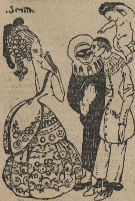
Es tan hermosa... tan final... El noy enredaire:—Més al bulto... més al bulto.

era llavors com ho es avuy un elefant; sino una personalitat gloriosa, un héroe de la Patria y de la Llibertat, el hijo del carretero de Grandátula, el vencedor de Luchana, el retirado de Logroño (llavors tots aquets ponderatfus se deyan en castellá) el Cincinnati español: D. Baldomero Espartero.