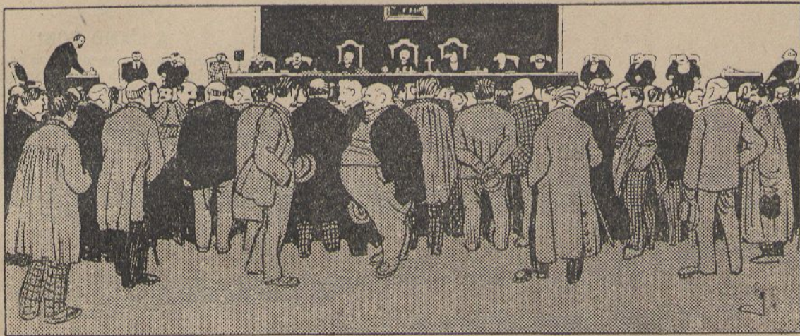
L'Audiencia.—Llum, taquígrafos y Jurat... Aixó es justicia.