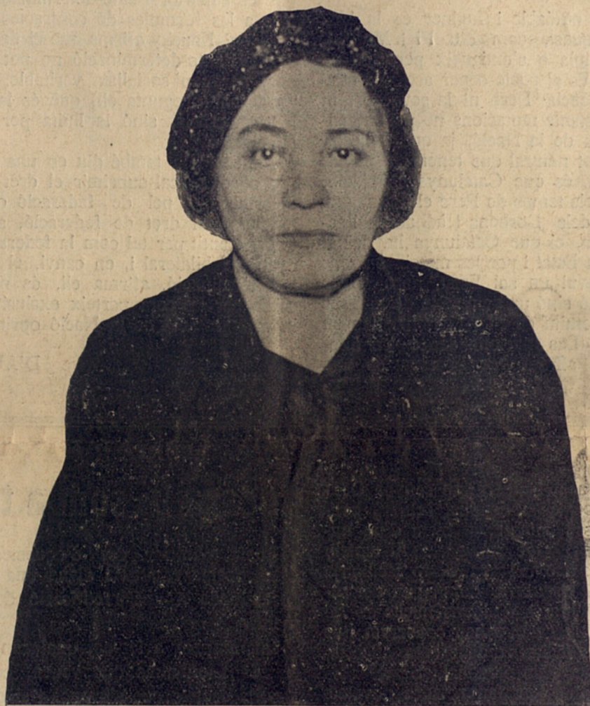
La Mare dels Màrtirs

La plaça de la Fe, és plena. Nosaltres fu- gim dels grups de representacions, on les o- pinions surten una mica mineralitzades a desgrat del moment apassionat i ens fem entre la gent. Hi ha una tònica de sentiment