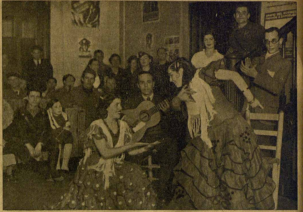
Des artistes andalouses donnent une séance au Foyer

En général et même en particulier, le poisson vit en toute saison, dans les lacs, dans les rivières, dans les étangs,