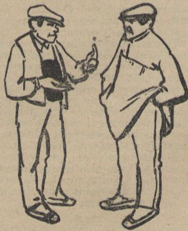
Per cinch pessetas, ja s'hi va fer tot lo que podia fershi! (Dib. de NANCH.)