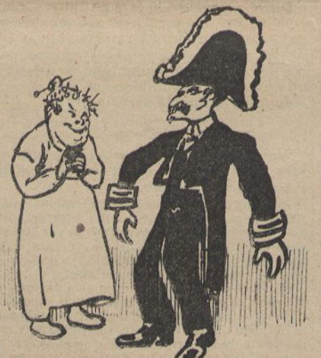
TORNANT DE LA FUNCIO DE GALA.—¡Y quina llástima que ara t'has de despullar!