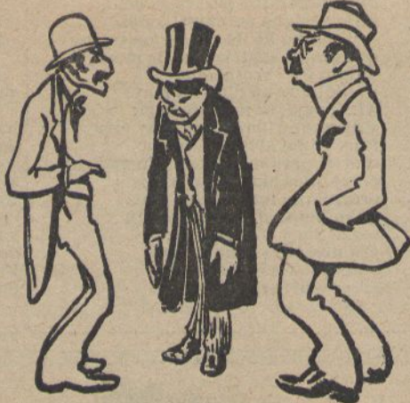
ENTRE MONARQUICHS.—Els grans gustos produheixen las grans postracions.