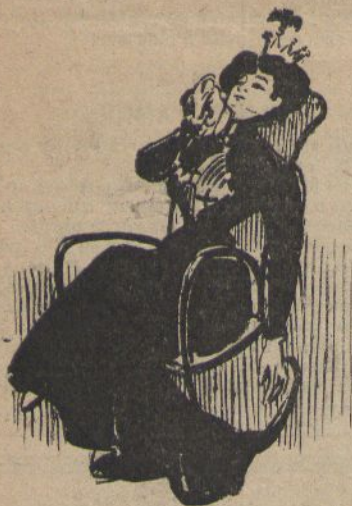
¡Ay, gracias a Deu que ja no sento olor de perfumeria barata!