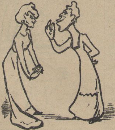
UNA ENTUUSIASTA.—¡Ay, filla! ¡Que m'va agradar quan feya aixis ab la má y ab la fesomia de la cara!