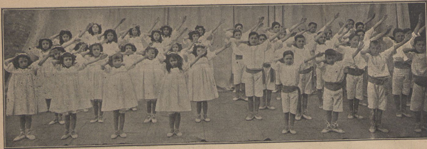
Las seccions de nenas y nens en sos exercicis de Gimnastica Ritmica , segons el metode de E. Jaques Dalcroze, que s'executaran, per primera vegada a Barcelona, el diumenje propvinent, dia 26 dels corrents, al Palau de la Musica Catalana.