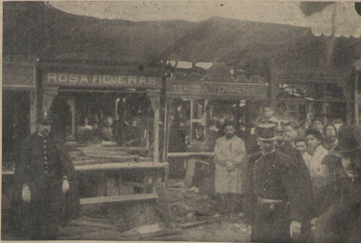
El lloch y efectes de l'explosió del diumenge al mercat de la Boqueria.