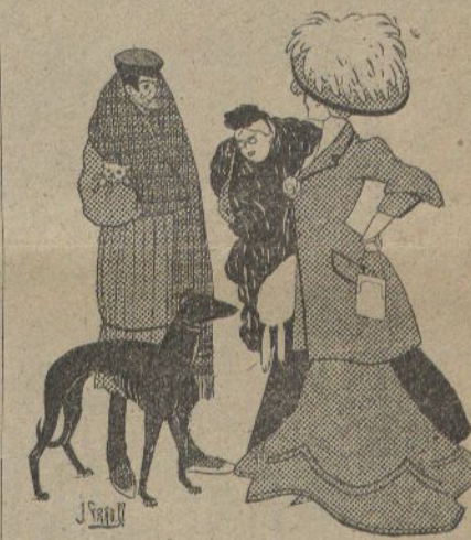
—Deu menjar molt, aquest gos?

—Ca, no ho cregui! Figuris que va neixer un divendres de quaresma.