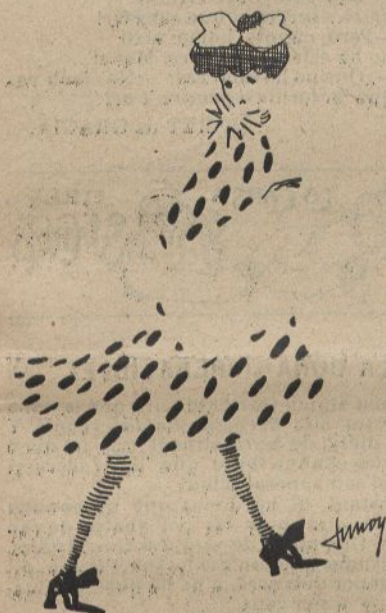
giran sempre la vista més encar que antes.

Y ab la por de las bombas, las elegantas