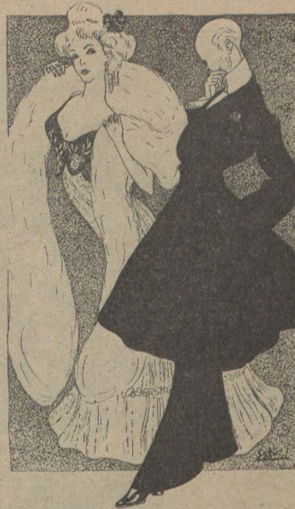
—Si no 'm compres un altra pell, en quatre dias quedaré sense.

—A n'aquest pas, qui quedará sense pell en quatre dias, seré jo.