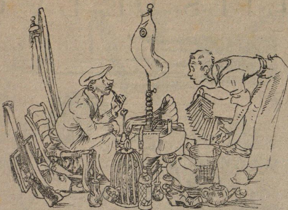
LA MANIA DEL REGATEIG

—Que una gitana em va pronosticar que em casaria dues vegades, i m'he reservat l'altre per la segona.